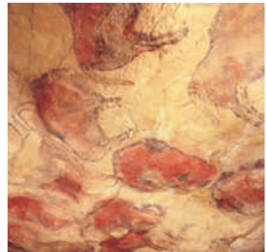
Pinturas em Altamira

As condições de acesso serão definidas por um grupo de peritos que reunir-se-á pela primeira vez no próximo dia 11 de Julho, em Madrid.