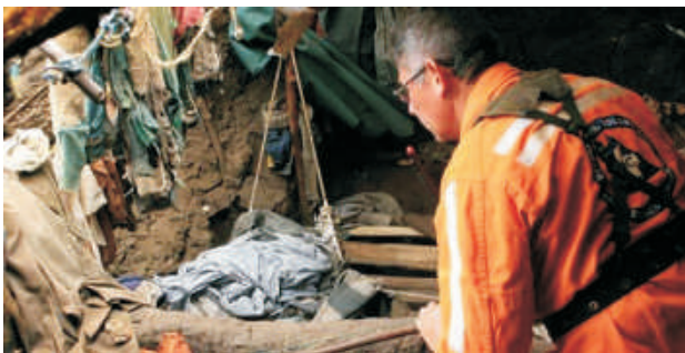
Imagens do resgate

Cinco crianças que, desde de seu nascimento, viviam em cavernas obrigados pelo pai - um homem aparentemente com problemas mentais - foram resgatados pelas autoridades em uma zona rural do centro-leste do país. "Como eles jamais tiveram contato com o mundo exterior, tirá-los de lá e dar um banho neles não foi fácil. Quando ligamos a televisão, eles saíram correndo", contou ao jornal El Tiempo de Bogotá Alirio Garzón, membro da Defesa Civil que participou no resgate.