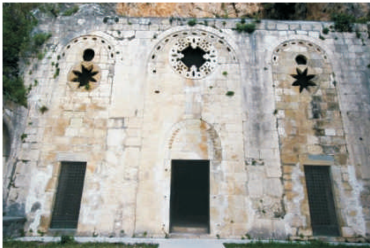
Entrada da Gruta de São Pedro