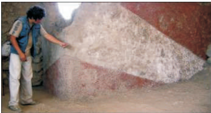
Um arqueólogo peruano mostra parte do santuário

Um santuário religioso e um painel rupestre de mais de 4.000 anos foram descobertos em um povoado da província de Chiclayo (norte do Peru), informou o arqueólogo peruano Walter Alva, com base nos resultados dos testes de datação. Alva, descobridor das Tumbas do Senhor de Sipán em 1987, disse que o santuário descoberto pertenceria ao período pré-ceramista arcaico de 3.500 a 1.800 a.C. "Isto significa dizer que quando construíram esses templos não se fabricava cerâmica, e sim, pinturas rupestres com símbolos e arquitetura desenvolvida".