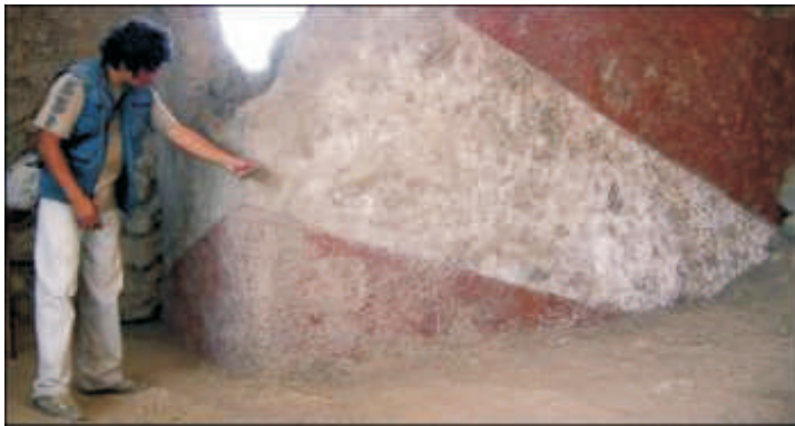
Um arqueólogo peruano mostra parte do santuário

Um santuário religioso e um painel rupestre de mais de 4.000 anos foram descobertos em um povoado da província de Chiclayo (norte do Peru), informou o arqueólogo peruano Walter Alva, com base nos resultados dos testes de datação. Alva, descobridor das Tumbas do Senhor de Sipán em 1987, disse que o santuário descoberto pertenceria ao período pré-ceramista arcaico de 3.500 a 1.800 a.C. "Isto significa dizer que quando construíram esses templos não se fabricava cerâmica, e sim, pinturas rupestres com símbolos e arquitetura desenvolvida".