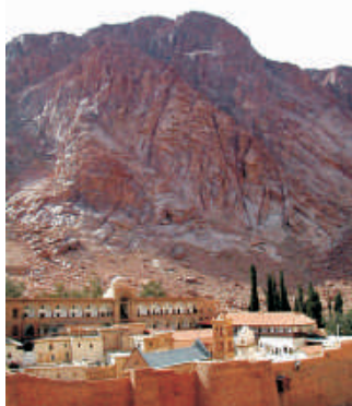
Mosteiro de Santa Catarina ao pé do Monte Sinai ( http://www.sacredsites.com )

Os arqueólogos observaram, nos muros da caverna, algumas inscrições de cor vermelha nas línguas grega e copta (idioma camito-semítico, do Egito Antigo e com influências gregas), sobre fundo branco. A partir das inscrições encontradas, os especialistas egípcios dataram o local entre os séculos 4 e 5 d.C. Há quatro anos, uma caverna parecida, usada como refúgio de cristãos contra as perseguições dos romanos, foi encontrada no país.