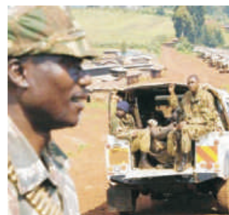
Forças de segurança patrulham a região de Chebyuk, distrito de Mt Elgon