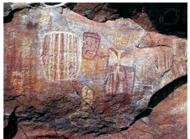
Pinturas rupestres em um dos sítios arqueológicos de Dom expedito Lopes

As mais conhecidas da população expeditense se encontram no bairro Alto da Bela Vista, (no Morro da Cruz) e no Alto da Passagem, (saco dos bois). Apesar de toda essa riqueza, os pequenos sítios encontrados estão sendo ameaçados por pessoas que não tem conhecimento da história do homem primitivo e destroem o patrimônio, pintando as paredes das cavernas e as rochas com carvão imitando as gravuras.