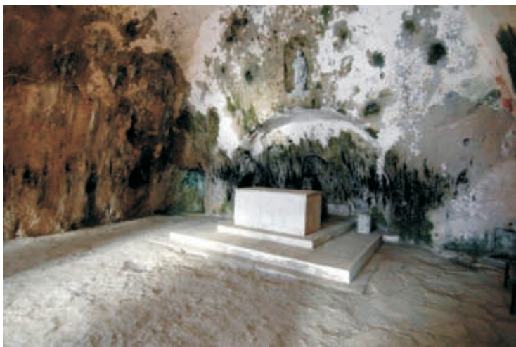
Altar no interior da Gruta de São Pedro

Apreciada por cristãos e muçulmanos da Turquia e considerada a primeira igreja da região, a Gruta de São Pedro está fechada desde 1º de março passado por risco de desmoronamento. Profundo conhecedor da história do país e dos lugares ligados aos primeiros tempos da Igreja, o Pe. Egidio Picucci, confirma a decisão das autoridades turcas de fechar o lugar sacro, uma cavidade natural no lado ocidental do monte Stauris que domina Antioquia.