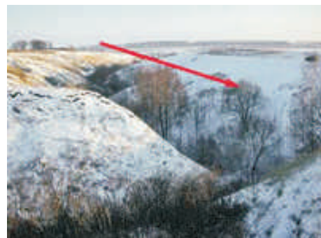
Localização da caverna.

Em outubro de 2007, cerca de 30 integrantes de uma seita russa se esconderam em uma caverna em uma colina na região de Penza, na região central da Rússia, para esperar pelo juízo final. O grupo era formado por 29 adultos e quatro crianças. Segundo a imprensa russa, eles teriam levado comida e combustível para o local e teriam ameaçado cometer suicídio explodindo um tanque de gás se a polícia interferisse. O líder da seita, Pyotr Kuznetsov, 43 anos, que não se juntou ao grupo, foi preso e está sendo acusado formalmente pelos promotores locais. O grupo afirmava que o mundo iria acabar em maio deste ano.