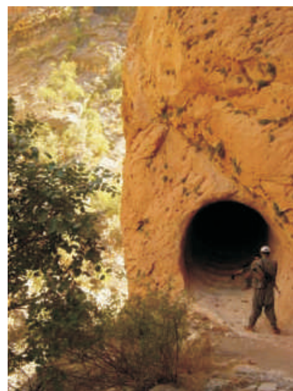
Guerrilheiro do PKK na entrada de uma das cavernas da região.

No entanto, em dezembro de 2007, autoridades da turquia afirmaram que incursões de aviões militares destruíram pelo menos três centros de comando, dois centros de comunicações, dois centros de treinamento para-militar, 10 instalações de defesa anti-aérea e pelo menos 182 cavernas que eram utilizadas como esconderijo e depósitos de armas e munições pelo PKK.