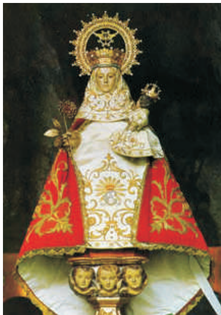
Imagem de Nossa Senhora de Covadonga

Uma imagem de Nossa Senhora de Covadonga foi colocada em uma gruta conhecida como o Santuário Mariano de Nossa Senhora «de la Roca», em Chichiriviche, no município Dom Iturriza, estado Falcón, Venezuela.