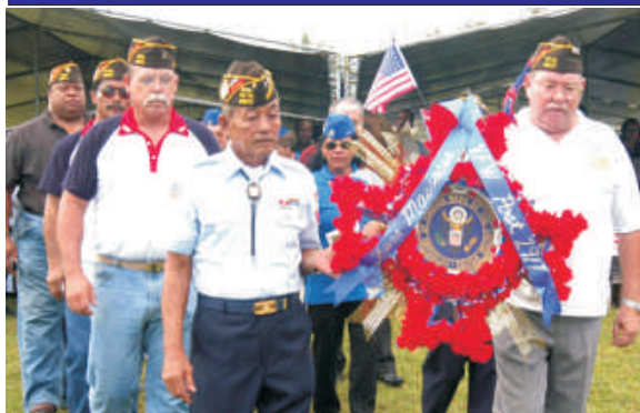
Veteranos e sobreviventes do massacre das Cavernas Fena prestam suas homenagens

Uma cerimônia em homenagem aos mortos durante a Segunda Guerra Mundial, na ilha de Guam foi realizada em julho deste ano. A história mostra que, com o avanço das tropas norte-americanas na região, as tropas japonesas forçaram homens, mulheres e crianças Chamorros a entrarem na Caverna Fena. Lá os soldados os agrediram com as armas, baionetas e granadas. Dos 100 civis reunidos pelos japoneses, cerca de 35 conseguiram sobreviver se escondendo sob os corpos dos mortos.