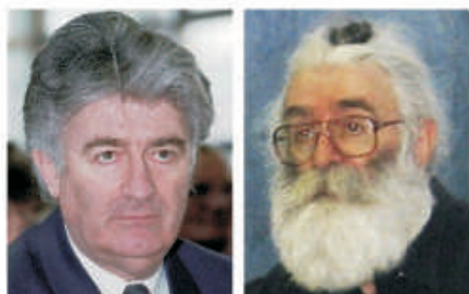
Na esquerda, der Radovan Karadzic em foto de Abril de 1996. À direita, foto de data desconhecida mas publicada na Healthy Life de Belgrado em 22 de Julho de 2008

O ex-líder sérvio-bósnio Radovan Karadzic, acusado de ter planejado crimes de guerra que incluem o pior massacre na Europa desde a Segunda Guerra Mundial (1939-1945), foi preso em julho em uma ação que pôs fim a uma busca de 13 anos. Seus crimes são descritos pelo tribunal da ONU para crimes de guerra como "cenas do inferno, escritas nas páginas mais negras da história humana".