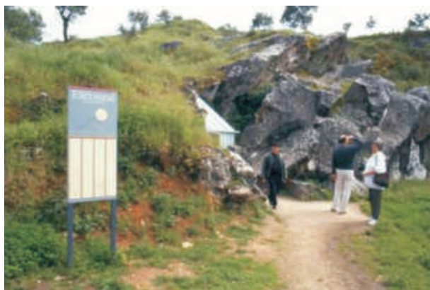
Vista da entrada da gruta e painel de informações