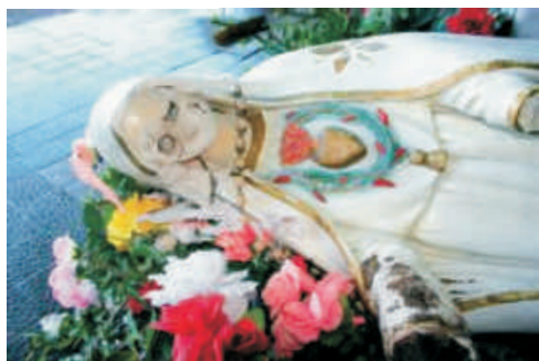
Estado em que a imagem ficou após a ação dos vândalos

Um dos pontos turísticos mais visitados de Santiago está ameaçado. Segunda-feira à noite, a Gruta Nossa Senhora de Fátima, no distrito de Ernesto Alves, foi transformada em um cenário de total desrespeito e vandalismo. No local, que, desde 1956, atrai visitantes e peregrinos de vários países, marginais quebraram todas as estátuas. Alguns detalhes na depredação chamaram a atenção da polícia: os olhos das imagens foram perfurados e, no altar, onde ficava a santa que dá nome à gruta, estavam dois bonecos de pano molhados.