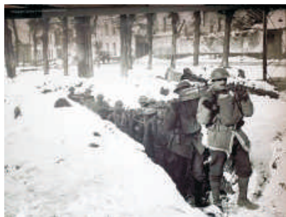
Soldados deixam a caverna durante o dia