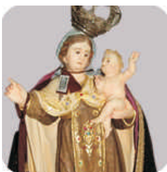
Imagens da Nossa Senhora do Carmo da Penha na Gruta do Santuário e seu detalhe no Santuário