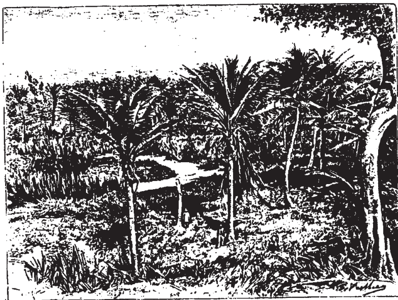
Réservoir de l'ancienne ville de Tecoch. - Dessin de G. Vuillier, d'après une photographie.