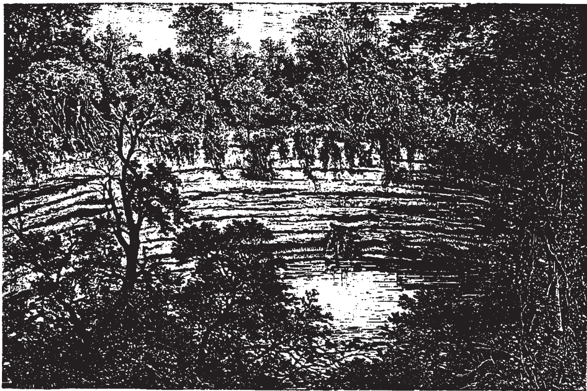
Cénôté sacré (voy. p. 42 et 43): - Dessin de A. de Bar, d'après une photographie.