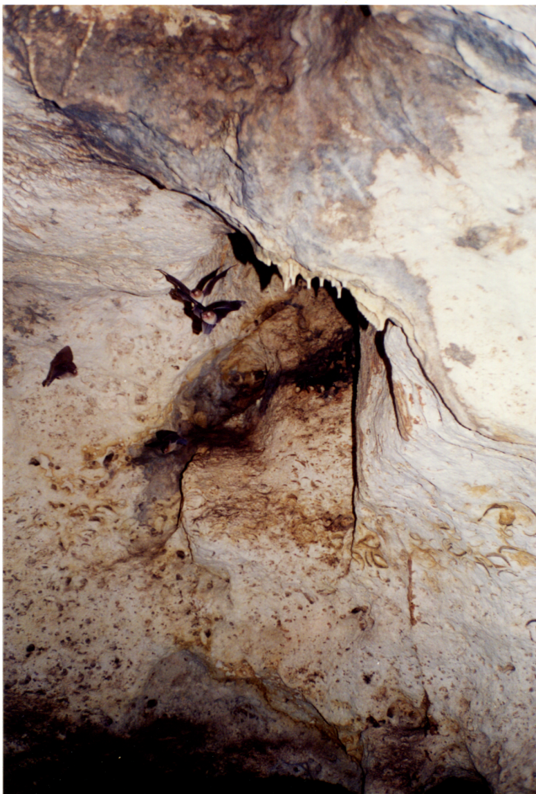
Murciélagos Natalus stramineus (Natalidae) en la Gruta del Rancho de Sambulá, Yucatán