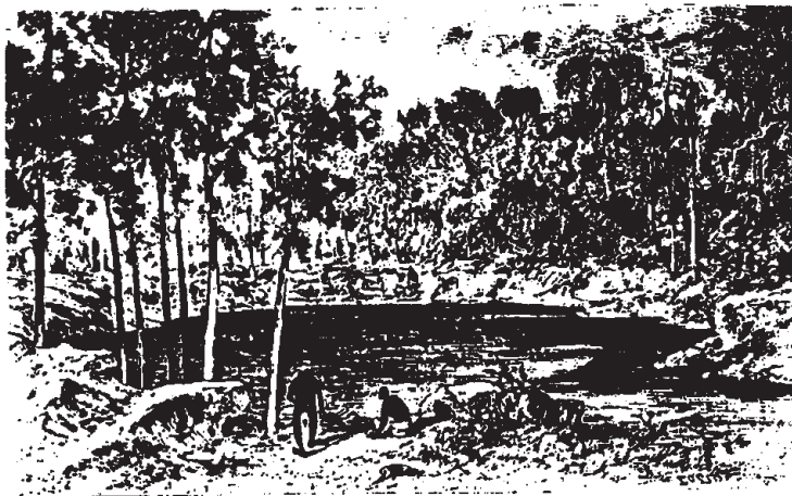
Cénôté de Xcolac. -Dessin, d'après un croquis de l'auteur