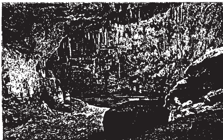
Cénote de Valladolid (voy. p. 293). - Dessin de G. Vuillier, d'après une photographie.