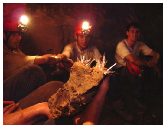
Cristais de Gipsita - Toca da Boa Vista

pontam a influência de ácido sulfúrico na gênese da caverna. As etapas evolutivas posteriores, incluindo as mais de 100 datações