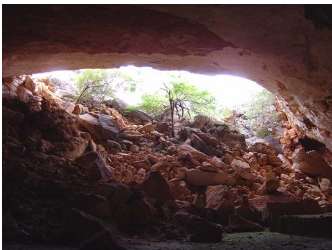
Entrada - Lapa do Convento

Esta atividade será ofertada provavelmente duas vezes durante o evento.