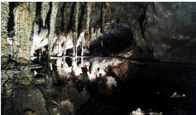
Salão dos Discos Voadores - Toca da Boa Vista

Embora as cavernas da região sejam muito pouco visitadas, julga-se necessário que algumas áreas mais frágeis sejam demarcadas com fitas, evitando que ocorra pisoteamento em espeleotemas ou feições no solo. Desta forma estaremos promovendo visitas para efetuar estas demarcações.