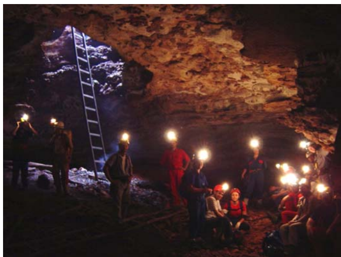
Abismo do Sapo - Toca da Boa Vista

A programação será divulgada oportunamente, mas deverá compreender uma palestra por noite.