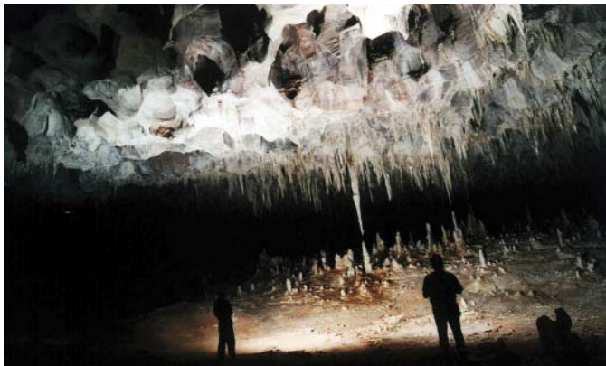
Toca da Barriguda