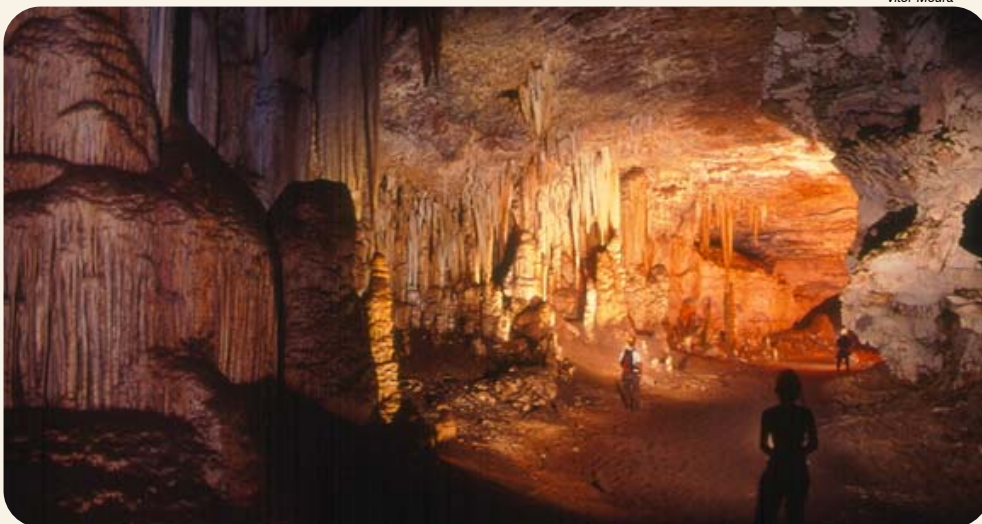
Toca da Boa Vista

Esta atividade será ofertada ao menos uma vez durante o evento.