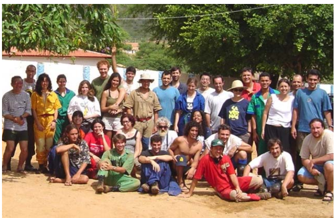
Equipe Toca da Boa Vista 100 km - 2003

Em 2007 completa-se 20 anos desde que uma expedição pioneira, em 1987, iniciou os trabalhos de mapeamento na Toca da Boa Vista. O Espeleo 2007 será um evento comemorativo, durante o qual os participantes terão oportunidade de vivenciar um pouco do mais antigo e contínuo projeto espeleológico brasileiro.