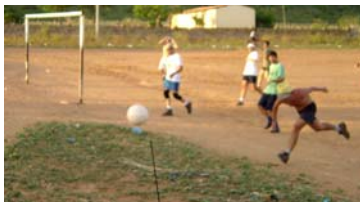
Crianças em Lajes dos Negros

Durante os dias de folga, serão organizadas excursões de lazer para as cachoeiras da região. A tradicional partida de futebol também será realizada, confrontando os casados (ainda invictos) contra os solteiros.