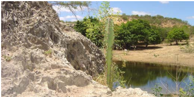
Tufas calcárias - Campo Formoso - Bahia

A Toca da Boa Vista e a região nos arredores de Laje dos Negros oferecem um excelente campo de estudos sobre as mudanças climáticas durante o último milhão de anos. Centenas de datações radiométricas e estudos de paleontológicos revelaram um ambiente muito mais úmido, coberto por florestas e habitado por grandes animais hoje extintos.