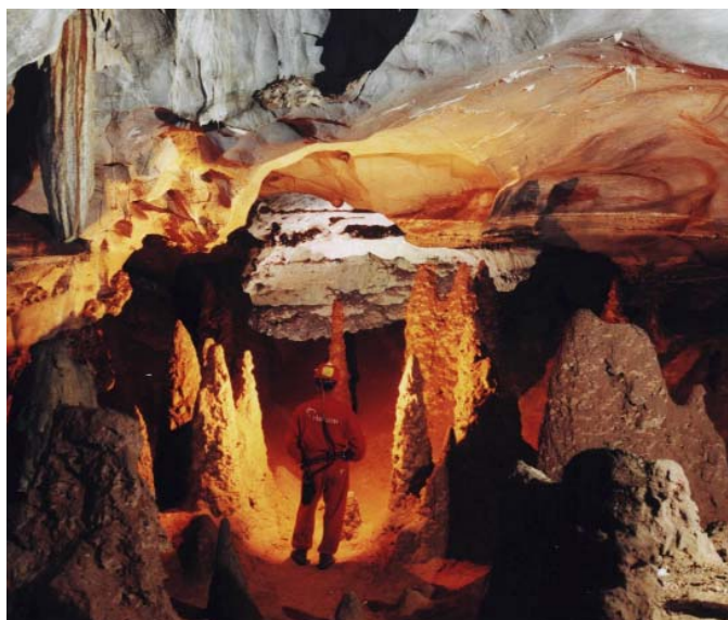
Salão dos Vulcões - Toca da Boa Vista

20 anos de Toca da Boa Vista Campo Formoso - Bahia