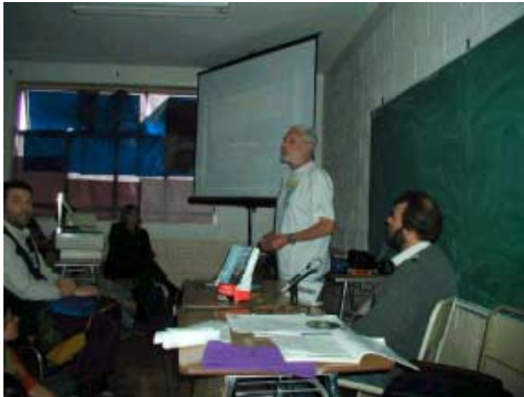
Exposición del Dr. Adolfo Eraso

detalles sobre otras exposiciones, creo que la conferencia que dio el Dr. Adolfo Eraso (España) sobre “Los glaciares árticos y antárticos ante el calentamiento global. Importancia del criokarst” a sala llena...superó cualquier expectativa. Su carisma y claridad expositiva hicieron que tuviera que repetirla mas tarde con un presentismo notablemente alto. Lo destacable de esto es que sus aportes no fueron aceptados directamente, dando lugar a debate, como el interesante contrapunto con el glaciólogo local Pedro Sqvarca.