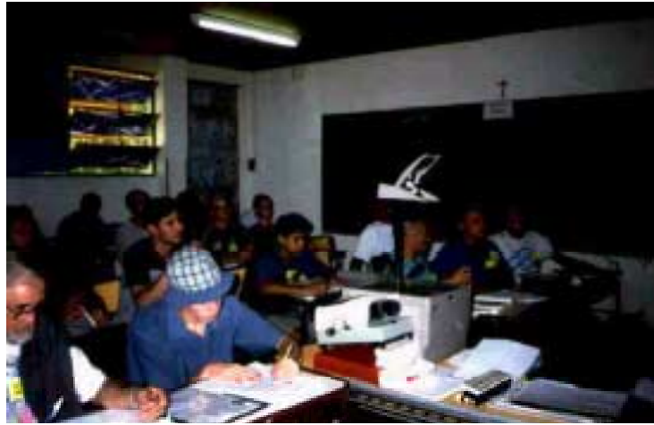
Clase teórica en Malargüe