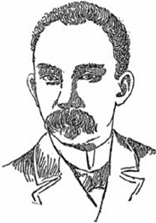
Delegato Jose Marti.

I will add in regard to the long credits given by European merchants that they are not given to everyone, but are the outcome of a sure knowledge of the people they are trading with, for in some republics a man's credit is better than in others. The English have made a special study of the credit system in South America, and they make few mistakes.