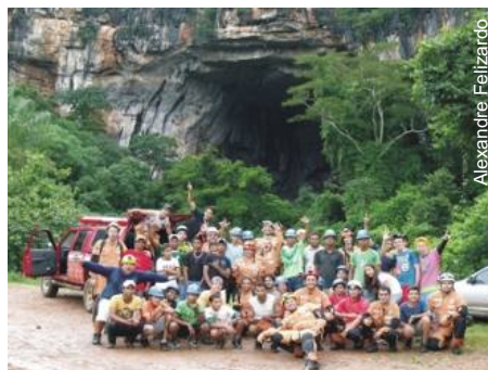
Lapa da Terra Ronca II (GO-001)

Realizou-se, ainda, o reconhecimento dos atrativos turísticos do Parque, com a produção de vasto material fotográfico, além das análises de impacto e da condição socioambiental da região.