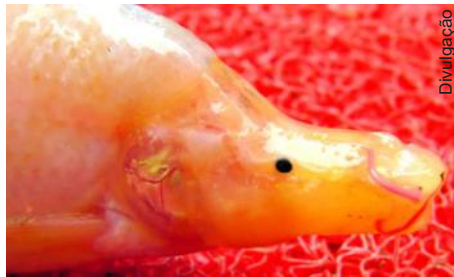
Chinese reverenciaram o peixe como alien divino

Na aldeia de Daluo, na província de Guangxi, sul da China, o assunto mais comentado é a aparição do peixe que tem boca parecida com a de um pato e visual de gosma. Ele foi visto no lago localizado ao fundo de uma caverna dentro da montanha Fu Yuan Dong (a “Caverna da Fortuna”). A aparência assustadora do bicho e o lugar peculiar da descoberta fizeram o povo do vilarejo concluir: trata-se de um peixe alienígena. Um ET aquático.