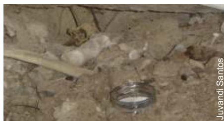
Armadilha no sítio Pinturas I

As possibilidades de ação dos colêmbolos nos sítios arqueológicos, inicialmente são três: (1) hábito alimentar, micófago; (2) formação do solo, fezes de Collembola abundantes; (3) endemismo nos sítios arqueológicos/espeleológicos devido ao hábito alimentar especializado. Os trabalhos vêm sendo desenvolvidos em quatro sítios arqueológicos da Paraíba: no sítio Pinturas I na cidade de São João do Tigre, Furna dos Ossos em São João do Cariri, Tanque do Capim em Seridó e no sítio aldeia Cabaças I em Cuité. Com exceção do último, os outros três são locais de sepultamentos ou atividades ritualísticas pós-morte, em cavidades naturais.