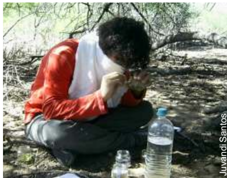
Trabalho com os minúsculos colêmbolos

Quanto ao (1) hábito alimentar, os colêmbolos preferem os fungos, estes últimos degradam os ossos dos sítios arqueológicos por contribuírem na primeira etapa, a degradação do colágeno na diagênese óssea, logo os colêmbolos auxiliam na conservação óssea se alimentando destes fun-