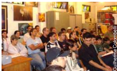
Esportistas eram maioria na palestra

As empresas estão se conscientizando que a produtividade aumenta com a segurança, o trabalho pode ser feito de forma mais rápida e até mais econômica.