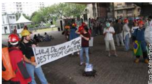
Protesto dos Capacetes: manifestação pelas cavernas

É esse desenvolvimento que precisamos ou queremos?