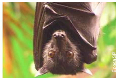
Seis “raposas voadoras” estão em exposição