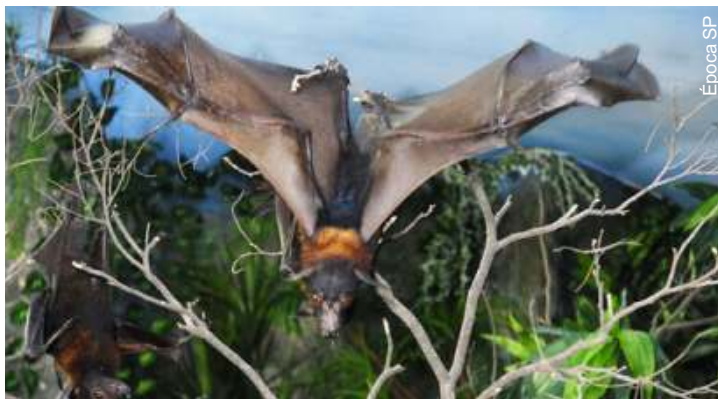
As asas do morcego gigante podem atingir até dois metros de envergadura

Encontrados apenas no sudeste da Ásia e desconhecido até então nas Américas, a espécie Pteropus Vampyrus vive em florestas e mangues, tem hábitos noturnos e dorme pendurada em árvores, de cabeça para baixo e enrolada pelas asas.