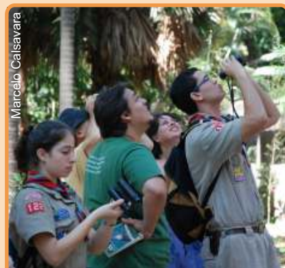
Birdwatching na sede da SBE em 2007

Durante a oficina apresentadas as técnicas de observação, além de alguns locais e as principais aves encontradas no município de Campinas.