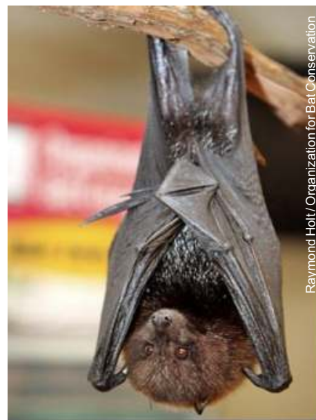
Tanner mede 1,22 metros e já não voa mais

Ele é o morcego mais velho e último de sua espécie mantido em cativeiro e ganhou pedaços de mamão, manga e melão pelo seu aniversário.