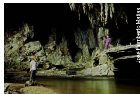
Ressurgência Gruta Angélica/Bezerra no PETeR

Concluir o processo de regularização fundiária no Parque Estadual de Terra Ronca (PETeR) está entre os principais objetivos da Secretaria do Meio Ambiente e Recursos Hídricos de Goiás para 2009. Já foram adquiridos 4.289 hectares de terras relativas ao parque, totalizando uma indenização de R$1,7 milhão. "Temos mais R$ 3 milhões de convênios com o governo federal para pagar estas indenizações", diz o secretário Roberto Freire. Em outubro, foram liberados outros R$ 8 milhões pelo governo estadual.