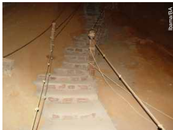
Escada de alvenaria construída sem autorização

Nesse momento, o Cecav está programando uma reunião com gestores ambientais do Ibama, SEMARH, Bahiatursa e representantes de empreendimentos turísticos da Chapada Diamantina, a fim de, juntos, encontrarem caminhos que possam resul-