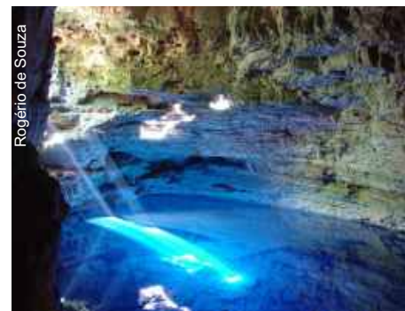
Poço Encantado (BA-202) Itaetê-BA