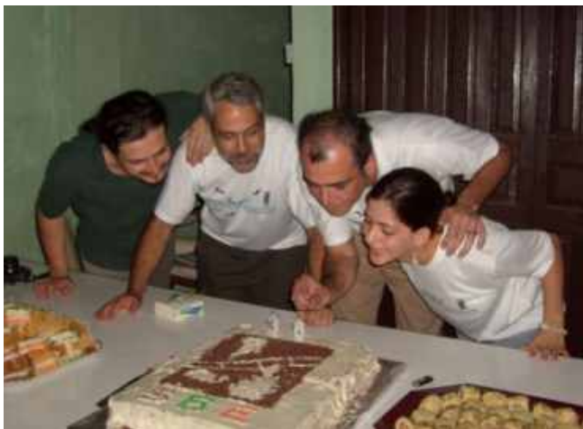
Descontração: Diretoria da SBE sopra as velinhas de 38 anos

No dia 1º de novembro, a SBE completou 38 anos de fundação e como uma data tão importante não poderia passar em branco, realizamos as festividades de comemoração nos dias 02 e 03 deste mês no município de Iporanga-SP, sul do estado de São Paulo, uma das mais importantes regiões cársticas do país.