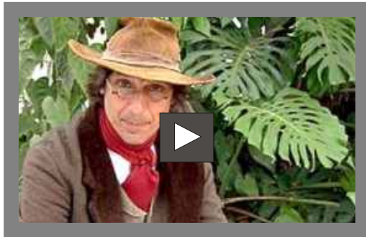
Clique na imagem para assistir ao vídeo ou na fonte para ler o texto completo