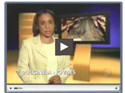
Clique na imagem para assistir ao vídeo

A TV Paranaense, filiada à Rede Globo de Televisão, exibiu a matéria “Aventura embaixo da terra”, gravada com os integrantes do Grupo de Estudos Espeleológicos do Paraná - Açungui (GEEP-Açungui).