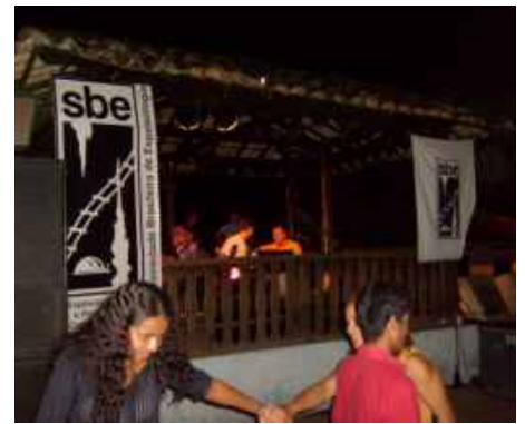
Banda Seth Wings animou a Praça Central de Iporanga-SP na noite de Sábado (03/11)