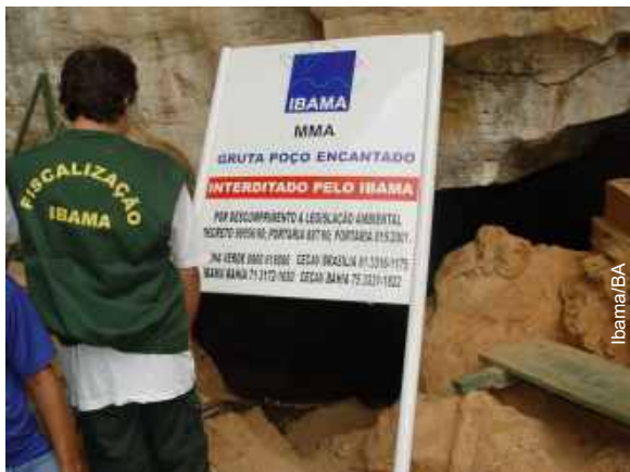
Placa de aviso fixada na entrada da gruta

A Gruta Poço Encantado - um dos principais endereços turísticos da Chapada Diamantina, que recebe anualmente de 12 a 15 mil turistas - foi interditada dia 06 deste mês, durante uma operação conjunta realizada por agentes do Escritório Regional do Ibama em Seabra e do Parque Nacional da Chapada Diamantina, em atendimento à denúncias do Centro Nacional de Estudo, Pesquisa e Manejo de Cavernas (Cecav).