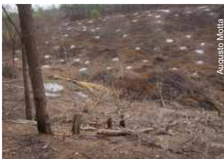
Área desmatada próximo à caverna

Fiscais do Ibama/GO realizaram atividades de monitoramento e prospecção espeleológica no Povoado do Luís, município de Posse-GO. Na região foi encontrado um desmatamento de 2,4 ha, em área de influência da Caverna do Luis.