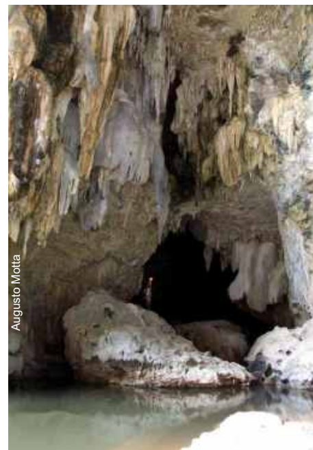
Caverna do Luis - Posse-GO

Uma vez constatada a operação ilegal, a informação foi repassada ao Escritório Regional de Alvorada do Norte - GO para que fossem providenciados os Autos de Infração e Apreensão e o Embargo da área.