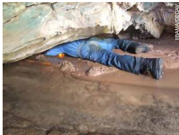
Caverna do Messias - entrada rastejante

cavidades, sendo que a denominada Caverna do Messias despertou um interesse especial, considerando-se a existência em seu interior de diversas cascatas e seu conduto principal passar abaixo do nível de um rio. Até agora os espeleólogos do IBAMA-GO em suas expedições cadastraram 44 (quarenta e quatro) cavernas na região.