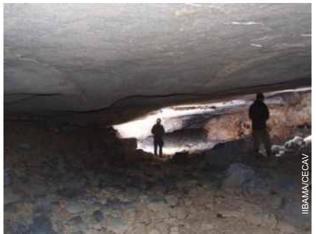
Gruta da Coruja Branca

Frente ao grande potencial cárstico da região, foram localizadas seis nova