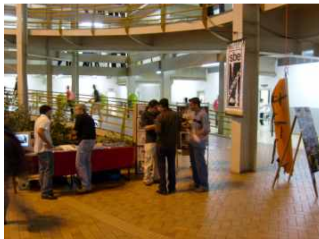
Alunos da UNIBAN tiram dúvidas com os sócios da SBE

Como primeira atividade oficial do projeto, a SBE participou da XI Jornada de Turismo na Universidade Bandeirantes (UNIBAN), em São Bernardo do Campo-SP, no dia 12 de setembro, com exposição de fotos, vídeos e equipamentos utilizados na espeleologia.