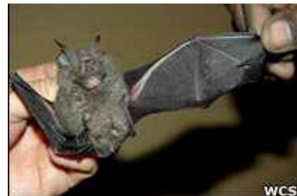
Nova espécie de morcego descoberta no Congo

Uma expedição da Wildlife Conservation Society (WCS) a República Democrática do Congo descobriu seis novas espécies de animais: uma de morcego, uma de roedor, duas de musaranho e duas de sapo.