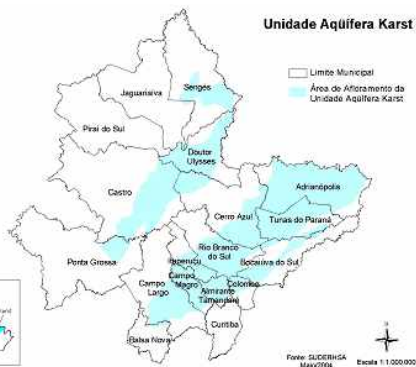
Área do Aquífero Karst no Paraná