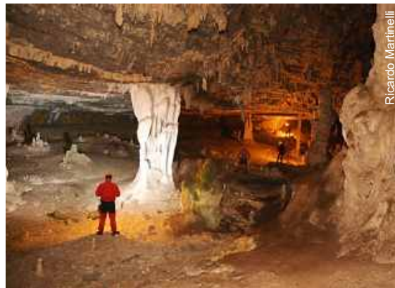
Grande salão na Gruta do Rio Ventura I

to. Durante a expedição, foram visitadas 9 novas cavernas que deverão ser cadastradas em breve, sendo que duas de pequeno porte foram topografadas.