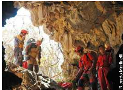
A equipe entrando na Gruna da Tarimba (GO-394)

A UPE - União Paulista de Espeleologia (SBE G079) e o GREGO - Grupo Espeleológico Goiano firmaram parceria para explorar e mapear cavernas nos municípios de Mambá, Damianópolis, Sítio de Adadia e Buritinópolis no nordeste Goiano.