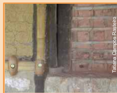
Tatiana Campos Rasteiro