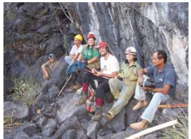
Parte da equipe da V expedição SBE-Tocantins

Finalizando nossos trabalhos em Aurora, foi ministrada para a comunidade uma palestra sobre 'formação de cavernas e noções básicas de espeleologia', onde mais de 50 pessoas lotaram o Centro de Eventos Sociais da cidade.