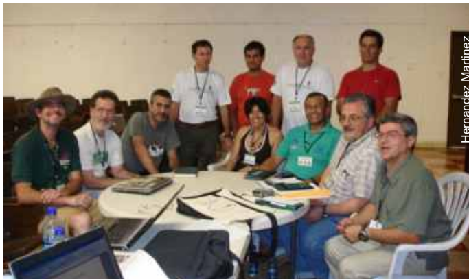
Assembleia Geral da FEALC, com participação da Argentina, Brasil, Colômbia, Cuba, Honduras, Venezuela, Porto Rico e México, Além de convidados do Líbano e EUA

ouros quatro continentes. Logo após a conclusão do congresso está prevista a reunião anual da UIS-União Internacional de Espeleologia, fator que possibilitou a presença maciça de grande número de pesquisadores de países fora da região da FEALC.