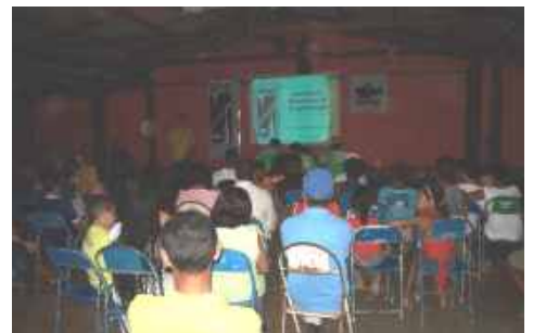
Palestra sobre cavernas para os moradores de Aurora

Cadastro Nacional de Cavernas do Brasil (CNC). A equipe de topografia mapeou quatro cavidades num total de 971 metros, entre elas a Gruta da Livosia e a Gruta das Rãs com raros espeleotemas. Alguns vestígios arqueológicos foram encontrados na região como: material lítico, cerâmicas e pinturas rupestres.