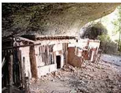
Abrigadas pelas cavernas as casas resistem ao tempo

Fontes: Folha Online 10/05/2007 Sala de Prensa Conacultura 11/05/2007