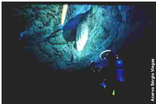
Mergulhador ilumina estalactite na Gruta do Mimoso, Bonito-MS.

Os caminhos para formação, tanto do mergulhador recreativo quanto do mergulhador de cavernas, também foram discutidos, bem como a Instrução Normativa 100, publicada em 05 de junho de 2006, que regulamenta a atividade de mergulho em cavernas no Brasil.