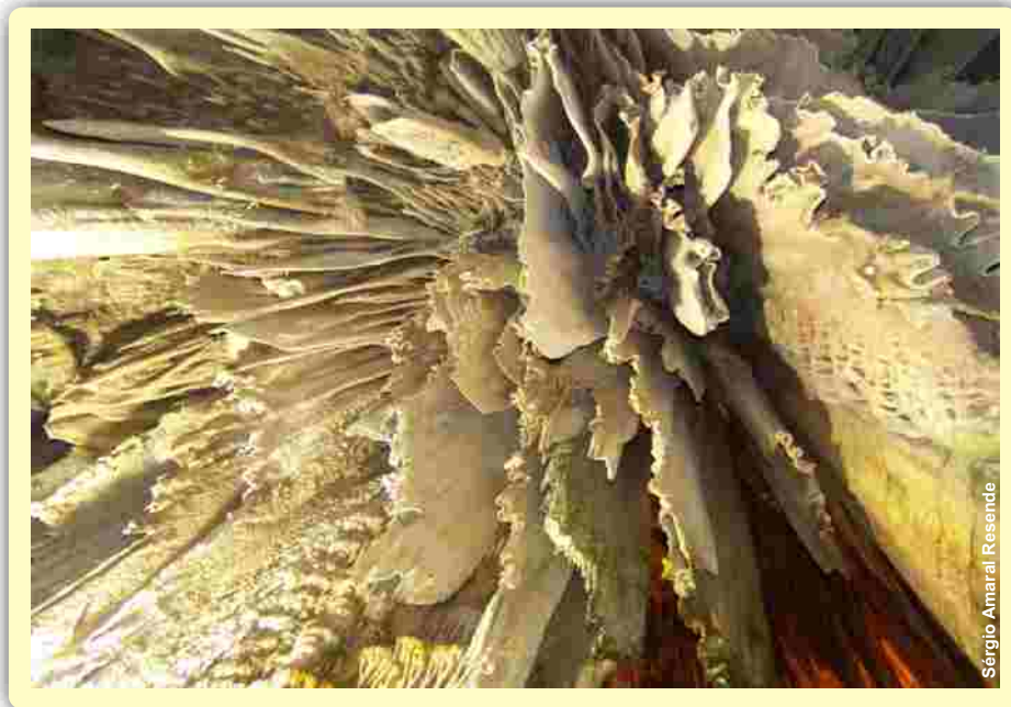
Sérgio Amaral Resende