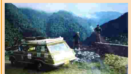
A Veraneio, veículo oficial da viagem, com as montanhas do Vale do Ribeira (SP) ao fundo