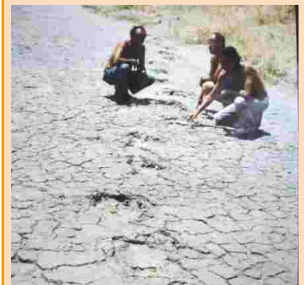
Na Paraíba, pegadas de dinossauros de 70 milhões de anos