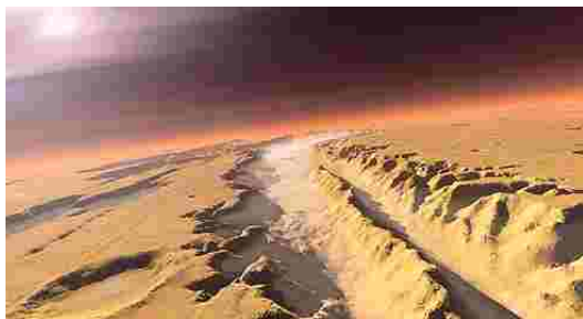
O planeta Marte continua a desvendar alguns dos seus mistérios

Segundo os cientistas, as cavernas podem ser as únicas estruturas naturais capazes de proteger formas de vidas primitivas dos mais variados ataques, que assolam constantemente a superfície marciana. A temperatura no interior das cavernas aponta exatamente nesse sentido, o que deixou a comunidade científica ainda mais entusiasmada.