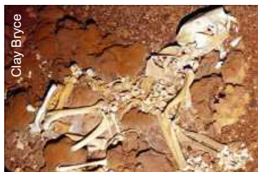
Fóssil encontrado - Veja mais fotos

Pesquisas indicam que o ambiente em Nullarbor era muito semelhante ao de hoje - uma região de solo árido com pouco mais de 200 mm de chuva por ano. O que mudou significativamente foi a vegetação.