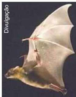
Detalhe do vôo

Breuer, um professor de engenharia, diz que os morcegos são intrigantes porque "podem gerar diferentes formatos de asa e movimentos de que outras criaturas não são capazes". "Morcegos têm capacidades únicas", acrescenta. "Mas o objetivo não é construir algo que se pareça com um morcego, e sim entender o