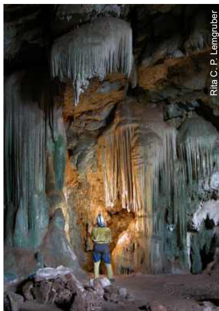
Rita C. P. Lemgruber

A geomorfologia local também é um atributo "positivo" quando se refere à beleza cênica da paisagem. Pode-se dizer que a cidade encontra-se numa grande depressão morfológica com fundo plano, cercada por