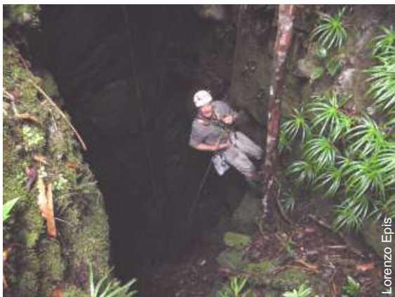
Anghileri na entrada do Abismo Collet (AM-3)

A descoberta do Abismo Guy Collet (AM-3), como foi batizado pelos exploradores da expedição ítalo-brasileira, com seus 670,6 metros de desnível foi divulgada em dezembro passado no periódico InformAtivo SBE nº92 e registrada no Cadastro Nacional de Cavernas do Brasil (CNC), atendendo as recomendações para expedições estrangeiras no Brasil da SBE .