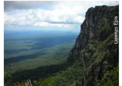
Vista da Serra do Aracá - Tepuys brasileiros

técnicos, exigindo muito trabalho da equipe, com jornadas de mais de 15 horas.