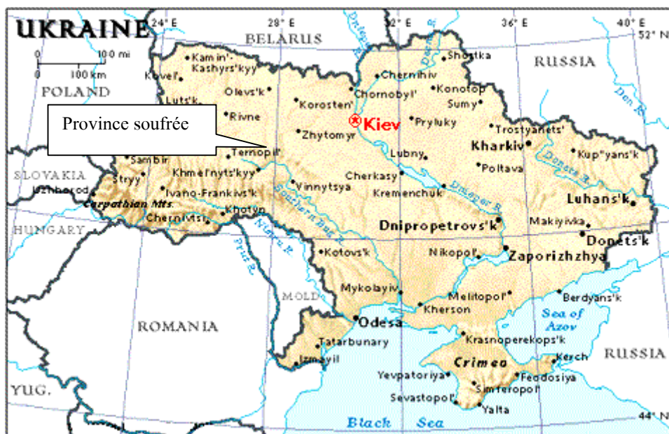
Fig.1 – Localisation des régions à sulfates étudiées sur la carte de l'Ukraine