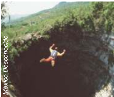
Base-Jump em Golondrinas

O abismo chega a um lance livre de 376m, o 6º mais profundo do mundo. Seu denível é de 512m e sua boca possui 55m.