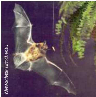
Morcegos: audição faz o papel da visão

06/03/2006