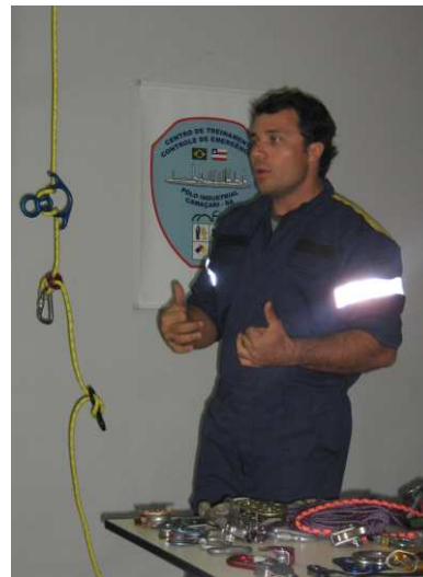
Pedroso explicando sobre técnicas verticais