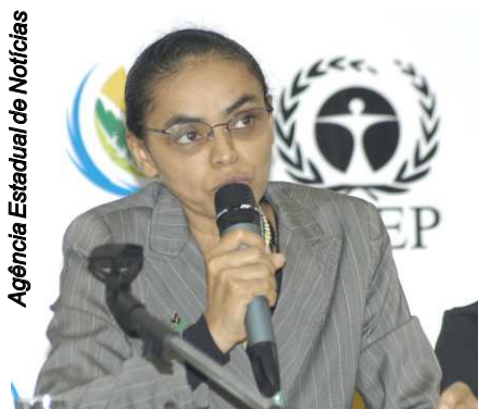
Agência Estadual de Notícias