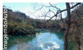
Imagem do Autor

Quem já esteve no município de São Desidério, cidade localizada no Oeste Baiano, compreende o emprego da palavra magnífico que geralmente é utilizada para descrever a Lagoa Azul - um dos principais atrativos do município - que possui reconhecidamente beleza cênica inigualável.