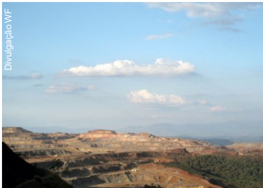
Extração mineral é uma das atividades que causa impactos na região