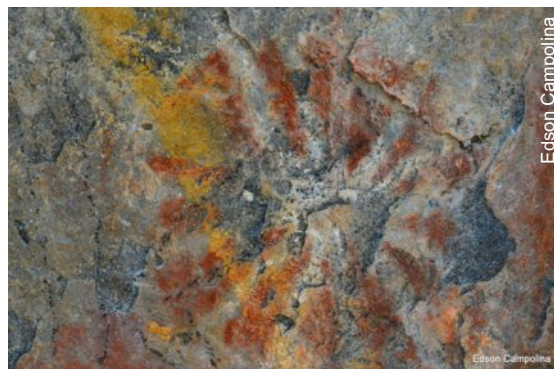
Semelhança com as pinturas de Andrelândia