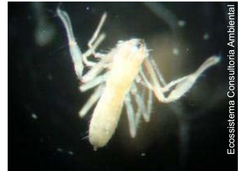
Ecosistema Consultoria Ambiental

habitam na caverna na maior parte do tempo não serão proibidas de interagir com o meio exterior? Como garante-se que não haveriam impactos sobre o microclima da caverna e a disponibilidade de alimentos das espécies faunísticas? Os estudos de impacto ambiental de grandes obras são