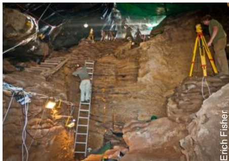
O sítio das escavações

Pequenas lâminas encontradas numa caverna da África do Sul comprovariam que o homem arcaico era um pensador avançado e que faziam instrumentos de pedras há 71 mil anos.