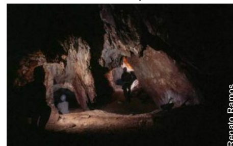
Gruta Novo Tempo

nio Espeleológico. Como resultado alcançado, conseguido por meio da caracterização da importância desta região no âmbito do patrimônio espeleológico fluminense e brasileiro, foram indicadas premissas e feita proposta para inserção desse complexo como unidade espeleológica no cenário nacional, integrando as Regiões Cársticas definidas pelo CECAV/ICMBio, através da Província Cárstica do Grupo Itálva.