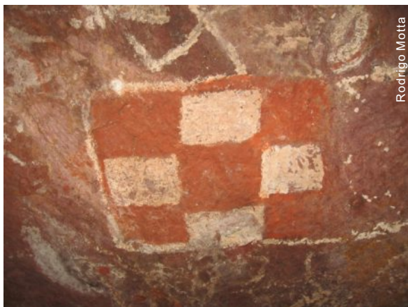
Caverna das Damas

O oeste do Pará, mais precisamente no Município de Rurópolis, localizado a 150 km de Itaituba-PA, destaca-se pela diversidade de cavernas de arenito contendo gravuras e desenhos rupestres.