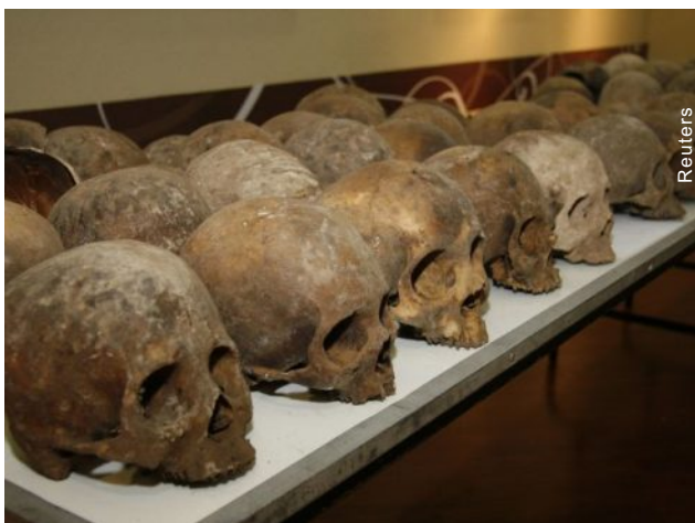
Restos mortais de 167 corpos foram achados em uma caverna no México

Fazendeiros encontraram os restos em um rancho a cerca de 20 km da fronteira com a Guatemala e chamaram as autoridades.