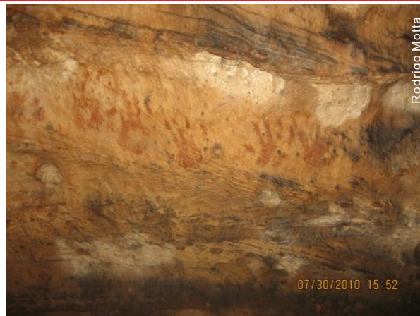
Caverna das Mãos, Aveiro/PA

A Caverna das Mãos é a de maior importância e tem esse nome por existir em seu interior a marca das mãos