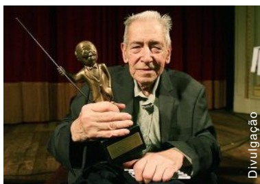
Aziz Ab'Sáber, ao receber o troféu Juca Pato como intelectual do ano

Aziz Nacib Ab'Sáber, um dos maiores especialistas em geografia física do país, bem como uma voz ativa nos debates sobre biodiversidade e preservação ambiental, morreu na manhã do dia 16 de março, em São Paulo aos 87 anos.