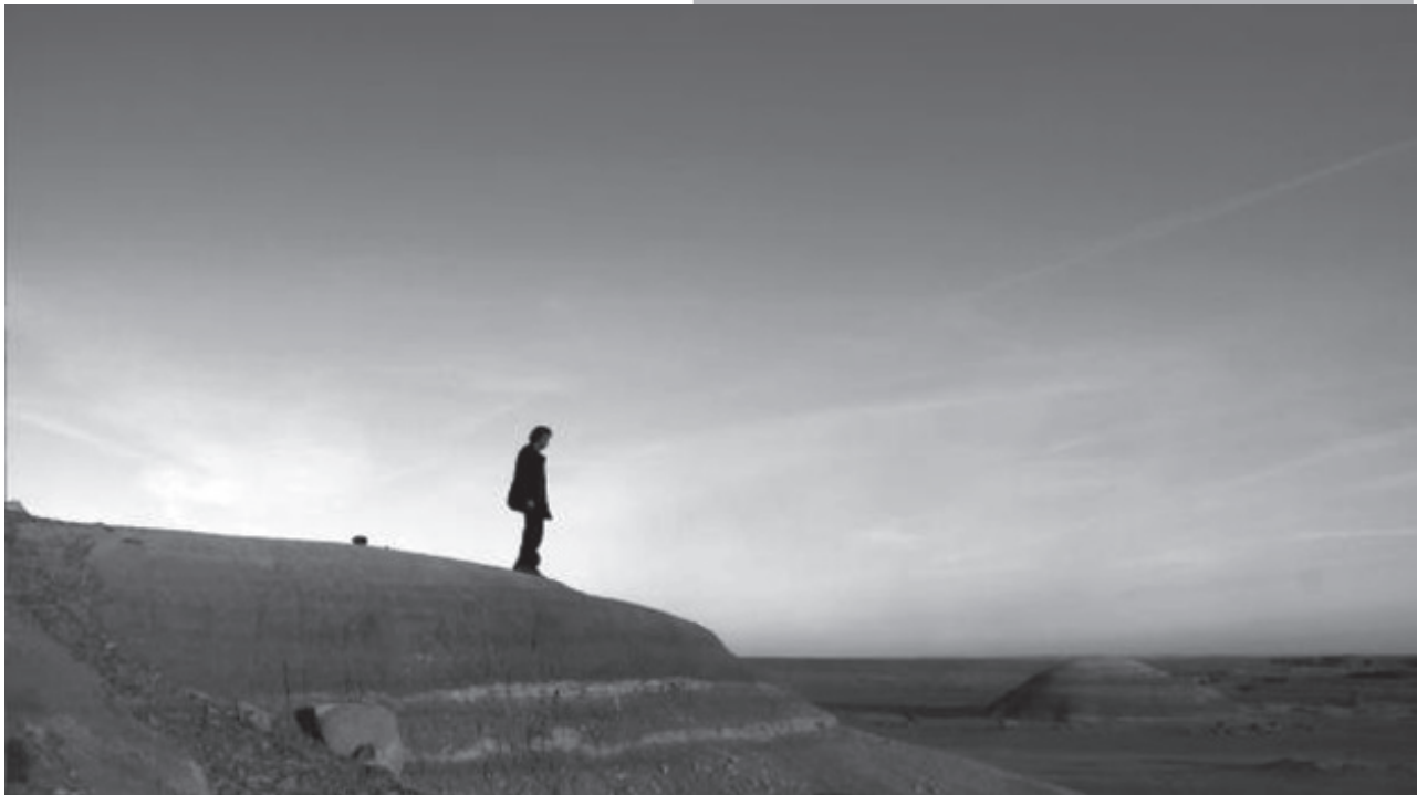
"¡Qué va, hay que filmarlo en el desierto!"

Poco a poco. Como la filmación duró cinco años, empecé con algunas locaciones que estaban ya en el libro. Claro, un poco más de la mitad de la novela transcurre en el campo, junto a las montañas Catskill, donde Edmundo sostiene la relación con la testigo de Jehová, que después en la película pasó a ser una mormona. Mi productor, David W. Leitner, me enseñó la fotografía de una cabaña en el desierto propiedad de una amiga, y en cuanto vi la casa, dije: "¡Qué va, hay que filmarlo en el desierto!" Pues el paisaje da la desolación y el aislamiento del personaje. El segmento con la mormona lo reduje al mínimo. Me pareció más la resolución de una trayectoria que una evolución narrativa. Para mí la mayor parte debería suceder en la ciudad, porque al fin y al cabo es Memorias del desarrollo . En la ciudad se fueron agregando elementos: la manifestación, la Parada Dominicana, el personaje de la esposa norteamericana, la pelea del divorcio, el juicio. Circunstancialmente, a medida que editas se te ocurren ideas y entonces vas, muchas veces sin