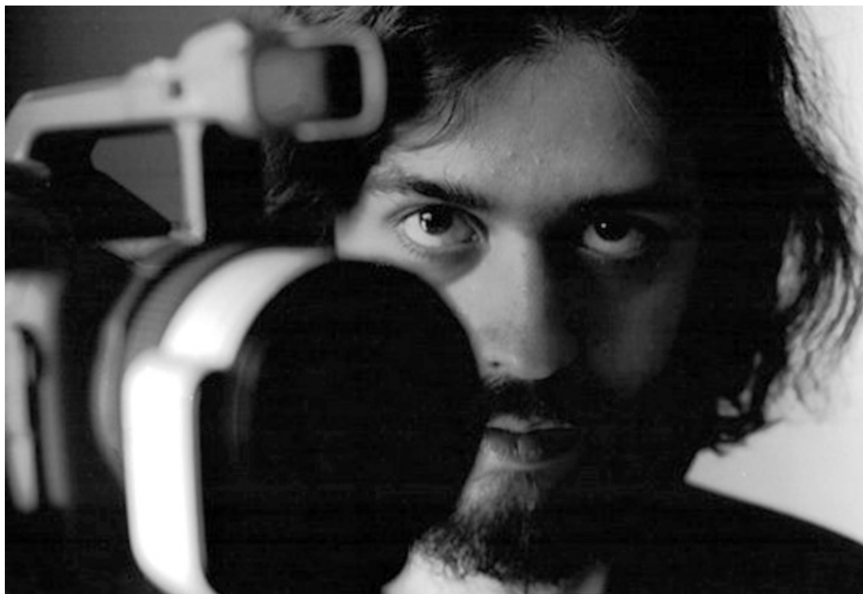
El realizador cubano Miguel Coyula

El protagonista está a mitad de camino entre las generaciones de Edmundo y la mía. Él dice que las tres grandes cosas que desprecia son la política, la religión y el consumismo. Es una actitud con la que me identifico mucho. Claro, nuestras biografías son distintas.