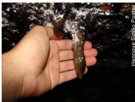
Estalactite apresentando cerca de 10 cm

Outro ponto visitado durante o trabalho foi um pequeno abrigo, o local apresenta estrutura para visitação situado em frente a gruta. Uma trilha suspensa que facilita o acesso para visitação e que ao mesmo tempo, é um fator que contribui para a conservação do sítio, pois delimita o acesso, possibilitando a proteção de importantes espeleotemas. A gruta, com desenvolvimento linear de 9 m, por 20 m de largura e média de 3 m de altura, trata-se de um geossítio de grande importância científica de Ponta Grossa e região. Seus espeleotemas apresentam tamanho proeminente em relação aos de outras cavidades subterrâneas da região. Trata-se de um aglomerado