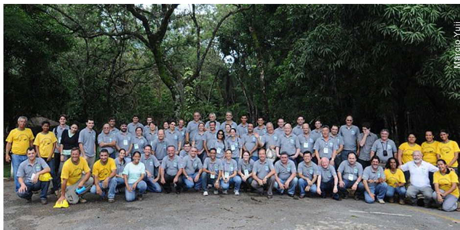
Encerramento do workshop no Parque Estadual do Sumidouro em Lagoa Santa MG

Na parte da tarde, para o encerramento do Workshop, foi organizada uma visita à Gruta da Lapinha conduzida pelos monitores ambientais locais. Todos saíram encantados com a caverna e conscientes da importância de compatibilizar desenvolvimento econômico com responsabilidade social e ambiental.