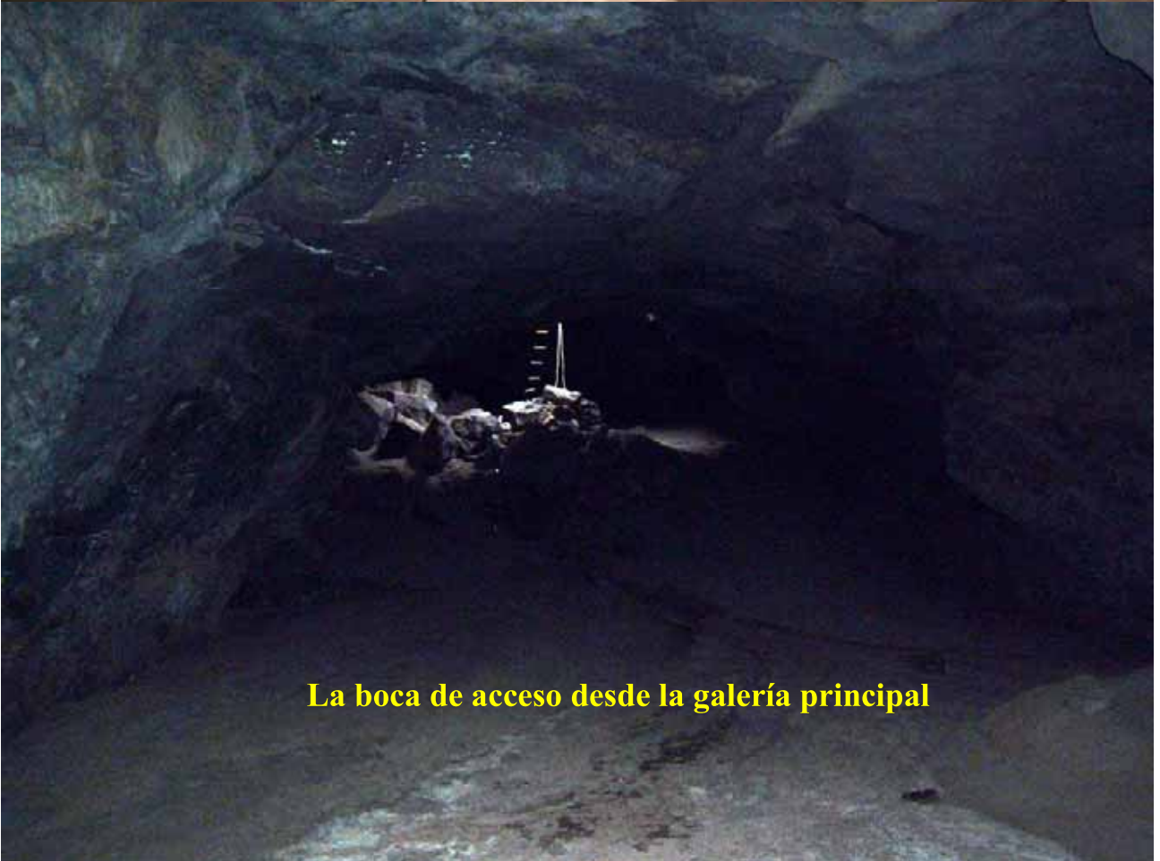
La boca de acceso desde la galería principal