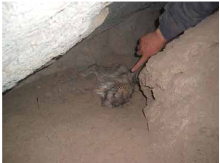
La chinchilla muerta del final de la galería). Sigue habiendo allí una corriente de aire