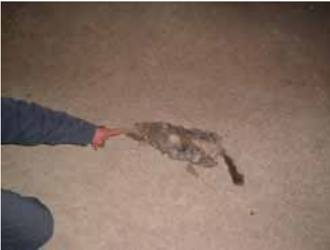
La cueva está seca, pero a mitad de su recorrido hallamos una chinchilla muerta y mucho guano de roedores....

La cueva del Tigre se encuentra a 37 Km. de la intersección de la Ruta Nacional 40 y la Ruta Provincial 186, Mendoza. La mayor parte de su recorrido (flecha roja) es paralelo a la ruta 186, en dirección hacia Llancanelo-Payunia-La Pampa. La exploración de superficie indica que la caverna continúa. En la exploración hipogea, al final de la galería hay una corriente de aire; allí, hace diez años, espeleólogos ingleses (Mendip Caving Group) y argentinos intentaron sin suerte remover la arena que obtura esa galería. En esta jornada se encontró allí el cuerpo de una chinchilla que buscó también infructuosamente una salida a su involuntario encierro. La corriente de aire sigue estando allí. En el óvalo del medio se señala el lugar donde pudo observarse gran cantidad de guano de roedores y otra chinchilla muerta. La flecha azul señala la boca de acceso (8 metros de desnivel) donde probamos la nueva escala de fabricación casera de la FADE