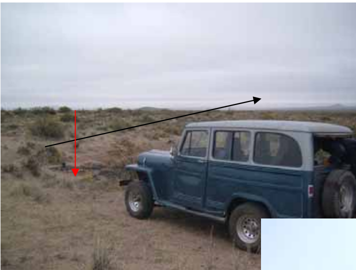
El INAE móvil frente a la boca de acceso. La flecha muestra, en superficie, hacia dónde se desarrolla la cueva. La flecha roja señala la boca de acceso