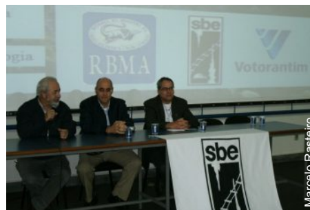
A cooperação foi apresentada no 31ºCBE

Serão envolvidos prestadores de serviço e voluntários que tenham interesse e conhecimento para atuar no processo e colaborar efetivamente na proposta de uma mineração mais responsável e no desenvolvimento da espeleologia brasileira.