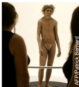
Estátua de Neandertal

Os cientistas já sabiam que cerca de 4% do DNA do neandertal e até 6% do DNA do hominídeo de Denisova estão presentes em alguns humanos.