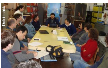
Reunião de planejamento PROCAD 4