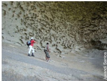
Franceses em caverna granítica da região

Mesmo assim, o parque ainda encanta, chama a atenção pela existência de belos espeleotemas de quartzo e concavidades nos abrigos naturais. Apesar dos problemas detectados, vale a pena visitá-lo, enquanto ele ainda existe.