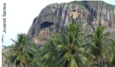
Parque Estadual Pedra da Boca

Entre os dias 20 e 21 de julho, seis espeleólogos do grupo "Terra e Água" da França, visitaram um dos parques estaduais mais interessantes da Paraíba: a Pedra da Boca. Este Parque é conhecido pela existência de inúmeras cavidades naturais (lapas, cavernas e abrigos sob rocha), de formação granítica e, também, pelo uso intenso dessas cavidades por grupos humanos pretéritos.