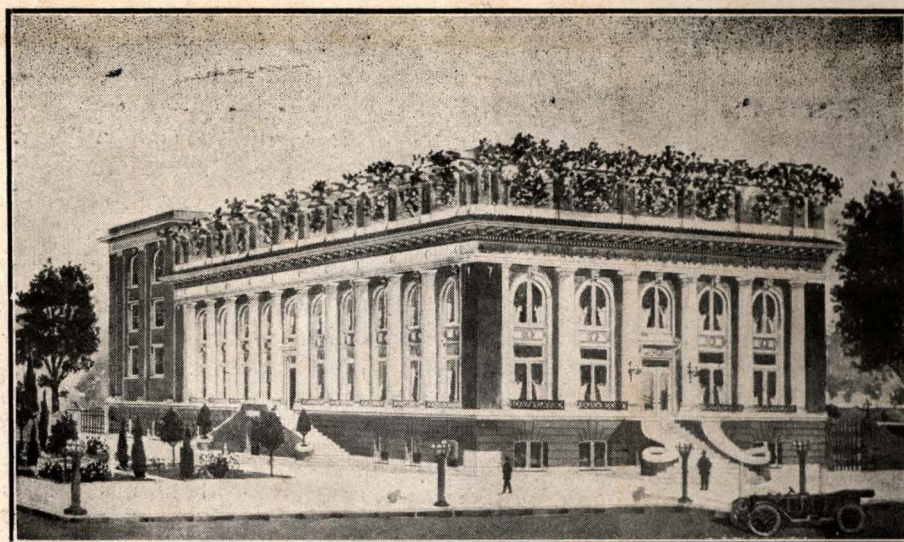
El nuevo edificio social del Centro Asturiano

“Si tratáis de hacer algo permanente en bien de la generalidad de los hombres, tenéis que principiar antes que sean hombres. El secreto del éxito consiste en trabajar con el muchacho y no con el hombre.”