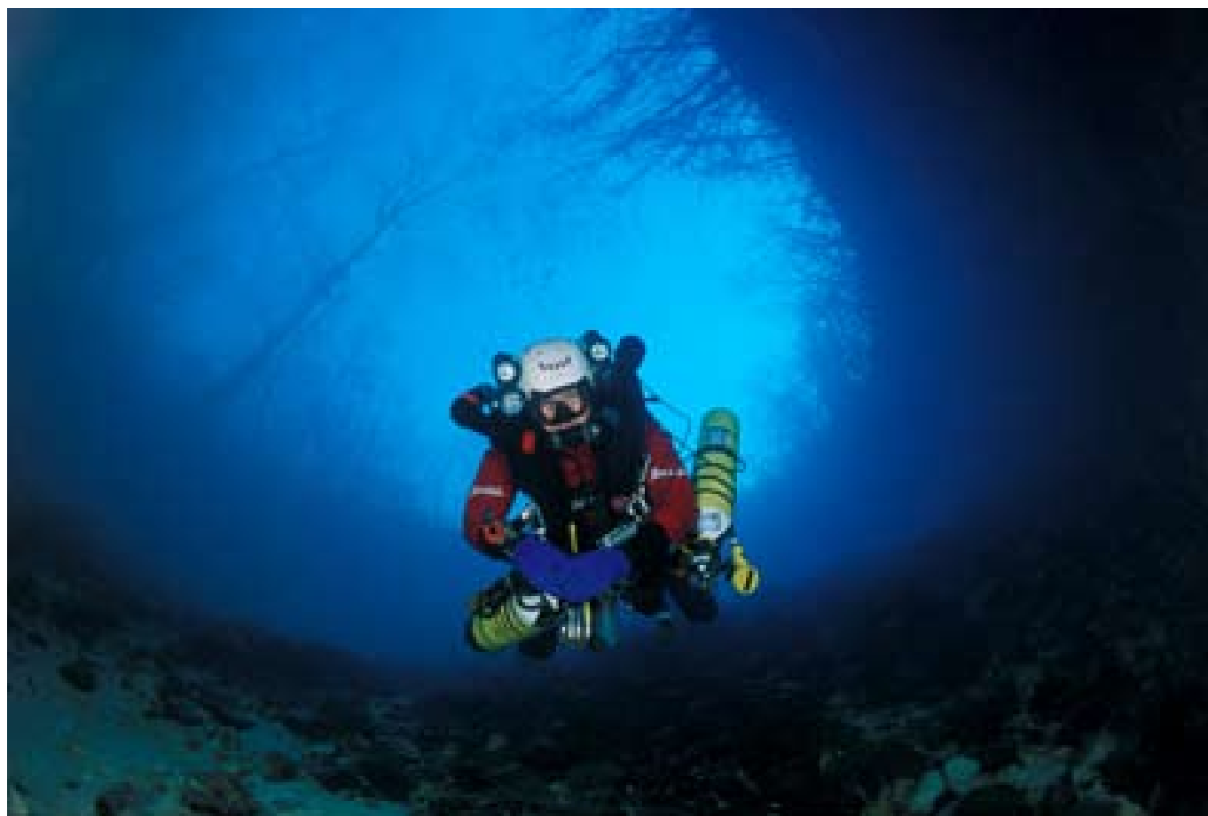
Luigi Casati in Gorgazzo, Italy. Start of the diving to -212 ( http://www.prometeoricerche.eu/GIGI/Report/gorgazzo_2008_FRA.htm ).

Retournons dans le siphon, nous avançons calmement, la combinaison serre légèrement mais tient chaud, le bruit des bulles répétitives berce. L'eau est trouble, la visibilité réduite à la seule présence d'un fil à quelques centimètres des yeux, parfois même non visible. La profondeur augmente peu à peu, la narcose (légère bien sur) s'installe. La partie rationnelle, liée à l'activité de veille du cerveau gauche s'endort gentiment, imperceptiblement, réduite de fait à l'inactivité par la disparition des stimuli extérieurs. L'obscurité du siphon est propice par lui-même à la stimulation de notre part inconsciente. Nous pouvons entrer doucement dans un rythme de génération d'ondes cérébrales alpha, dans un état de dépendance à