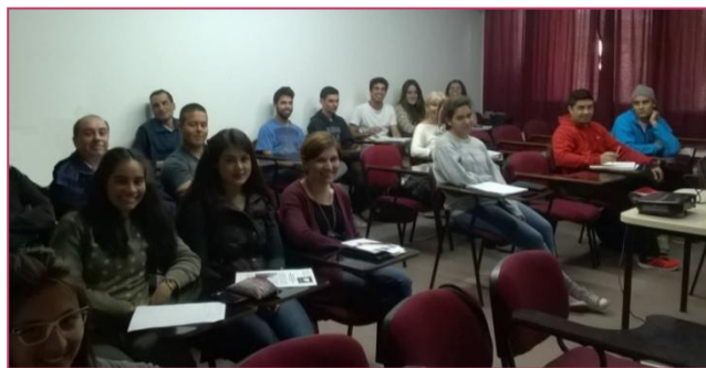
Asistentes en la Universidad Nacional de Cuyo