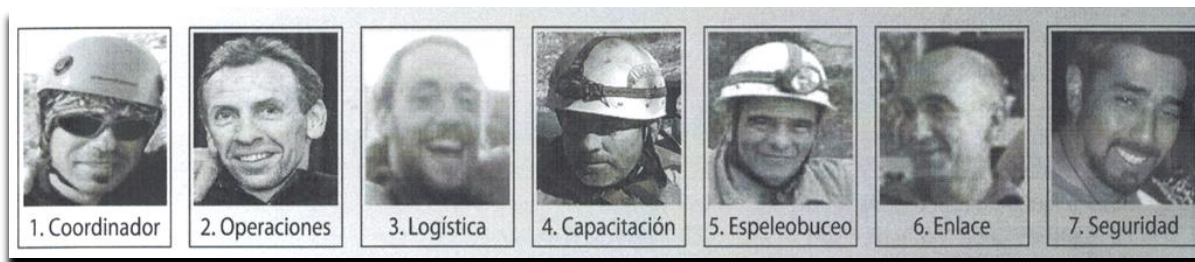
miembros de la Comisión Nacional Argentina de Espeleosocorro CNAE