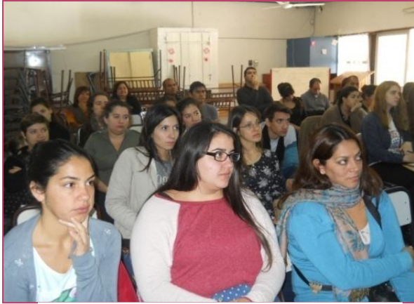
Asistentes a la conferencia en ISTEEC