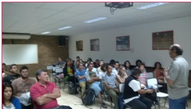
Asistentes en IEF 9-016 "Dr. Jorge E. Coll", Mza.