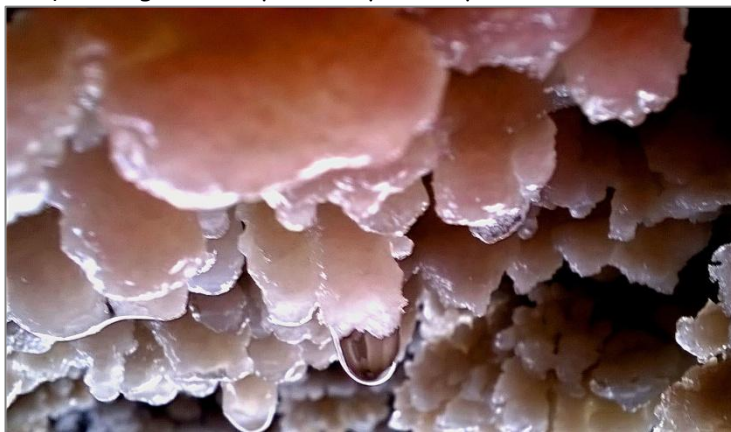
Concreciones en la cueva Blanca.

Esta cavidad se caracteriza por el entorno travertínico, producto de la precipitación química de aguas muy salinas, de un nivel freático que surge en su parte superior, y, en consecuencia, el goteo genera concreciones en su interior de costras de carbonato mamelonado entre los cuales crecen esporádicamente, cristales de halita. También se observaron, en los espacios adecuados, helictitas.