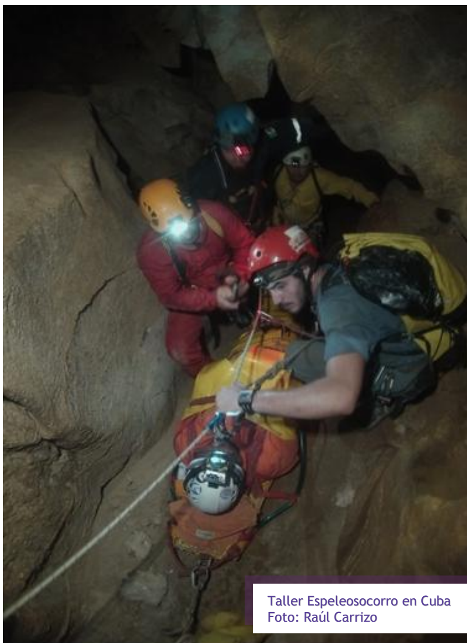
Taller Espeleosocorro en Cuba

Boletín Electrónico de la UNIÓN ARGENTINA DE ESPELEOLOGÍA