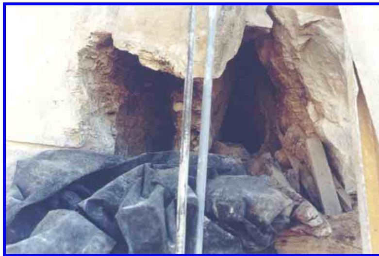
Últimas fotografías de Cueva Mallegni. La cavidad cercenada en 2001 desapareció en 2004 fruto de las voladuras.

Tenemos la certeza de tener razón, la certeza de que la Ley nos ampara, que las leyes están siendo violadas y de que no podemos permitir tanto atropello.