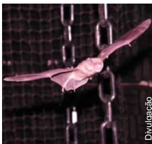
Usam até campo magnético

Os morcegos, únicos mamíferos capazes de voar, conseguem evitar os obstáculos e chegar a seu destino sem problemas através da escuridão, graças a um sistema de sonar e a uma capacidade de voo sofisticados, segundo dois estudos publicados dia 29 de março.