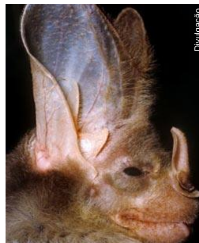
A beleza está nos olhos de quem vê!

Chamado de morcego fantasma pelo visual não muito atraente, ele foi visto numa caverna na região central da Austrália.