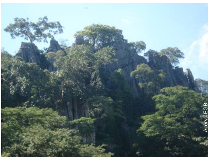
Vista do Morro da Pedreira ou Morro do Urubu em Sobradinho DF

Com 13 cavernas o complexo do Morro da Pedreira ou do Urubu é de suma importância para formação técnica e esportiva dos espeleólogos da região. Por suas feições e pela facilidade de acesso, é a mais importante, senão única, área do DF onde os espeleólogos podem aprimorar as técnicas verticais em condições ideais.