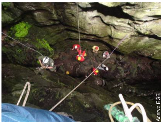
Treinamento do EGB no local

No dia 26 de março, o Espeleo Grupo de Brasília (EGB) participou de uma audiência pública com o objetivo de propor a criação do Monumento Natural do Conjunto Espeleológico do Morro da Pedreira, na Fercal, zona rural de Sobradinho (cidade satélite de Brasília), englobando um complexo de cavernas de grande importância para a região do Distrito Federal (DF).